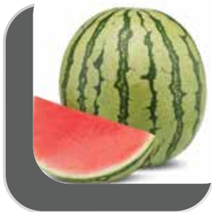
BLANCA | ANGURIA | WEIS | WHITE (*)