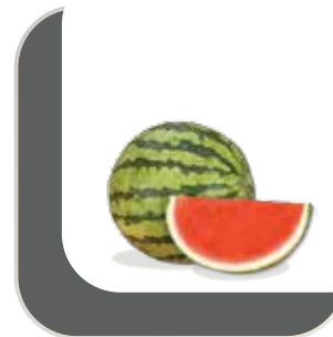
BLANCA MINI | ANGURIA MINI | WEISS MINI | WHITE MINI (*)

(*) CON Y SIN SEMILLA | CON E SENZA SEMI | MIT KERN UND KERNLOS | SEED AND SEEDLESS