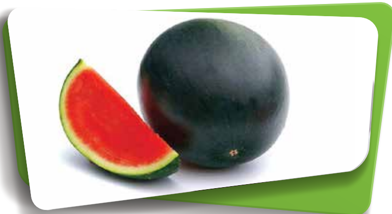
NEGRA | NERA | SCHWARZ | BLACK (*)