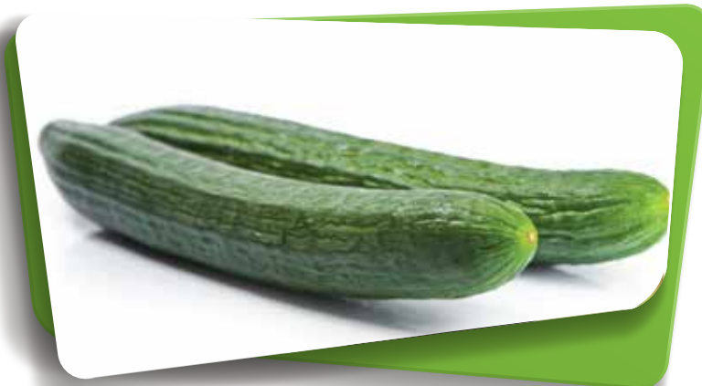
PEPINO HOLANDES | LUNGO | GURKE | LONG CUCUMBER